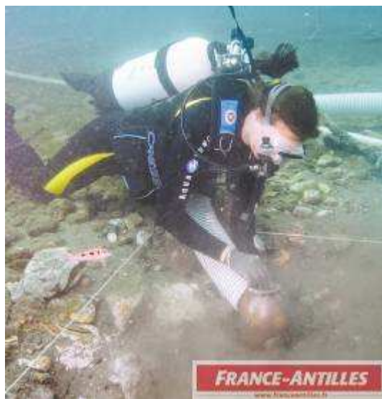
Des milliers et des milliers de céramiques gisent sous l'eau, dans la baie de Saint-Pierre. La législation interdit désormais de se servir.